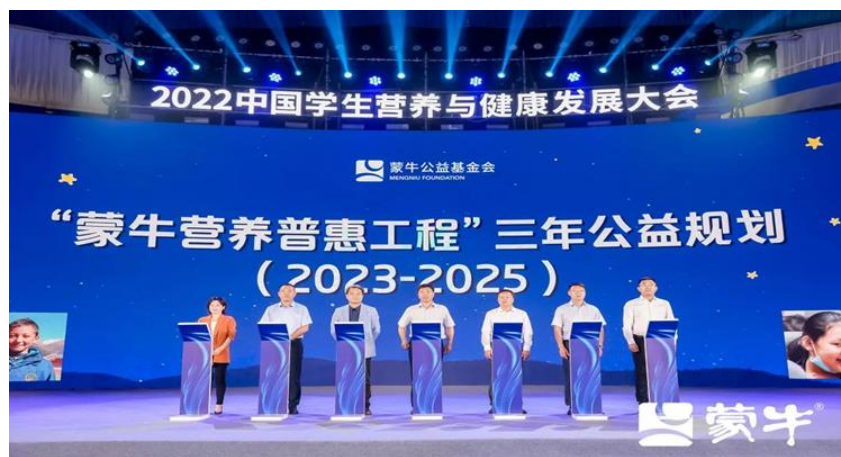
2022 中国学生营养与健康发展大会

2022，蒙牛继续践行以学生奶为代表的公益活动，点滴营养绽放每个生命。通过开展“未来星”助学计划、“一分钱公益”等活动，蒙牛在全国 20 个省 58 个市的 277 所学校开展营养普惠工程牛奶公益捐赠项目，捐赠牛奶 397 余万包，覆盖学生 17.92 万人次，并在“2022 中国学生营养与健康发展大会”上，承诺将在未来三年向全国学校捐赠 3000 万元的学生奶。此外，在抗震救灾、敬老爱幼的公益前线，蒙牛也从不缺席。