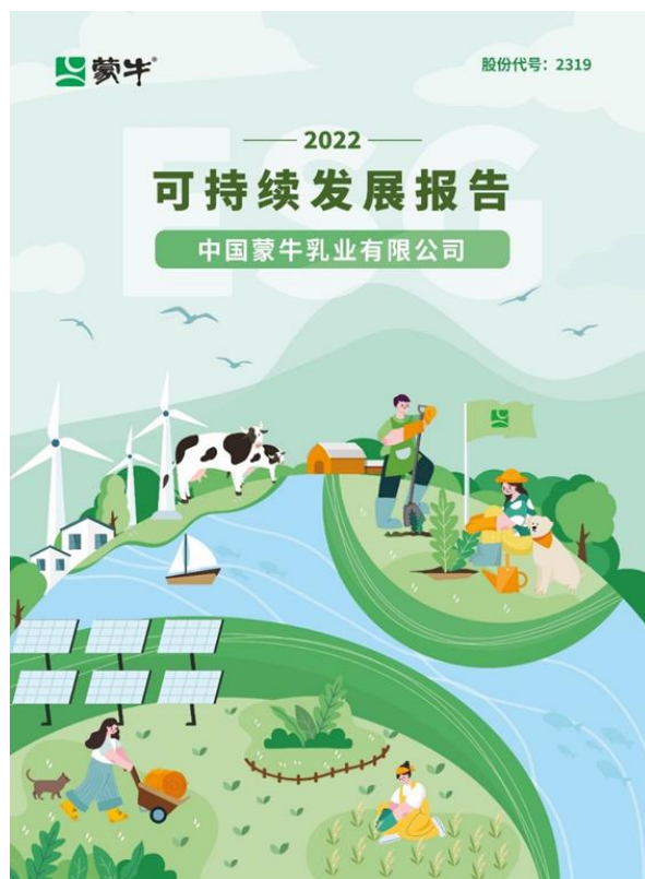
蒙牛 2022 可持续发展报告

蒙牛集团总裁卢敏放表示，蒙牛不仅推动自身 GREEN 战略各项议题的落地，还将 ESG 治理、社会及环境责任理念方法传递至上下游产业链，打造了一批零碳工厂、废弃物零填埋管理工厂，开展了绿色包装行动、生物多样性保护行动、责任供应链管理、绿色营销等项目，以更具韧性的产业链，持续引领行业可持续发展。