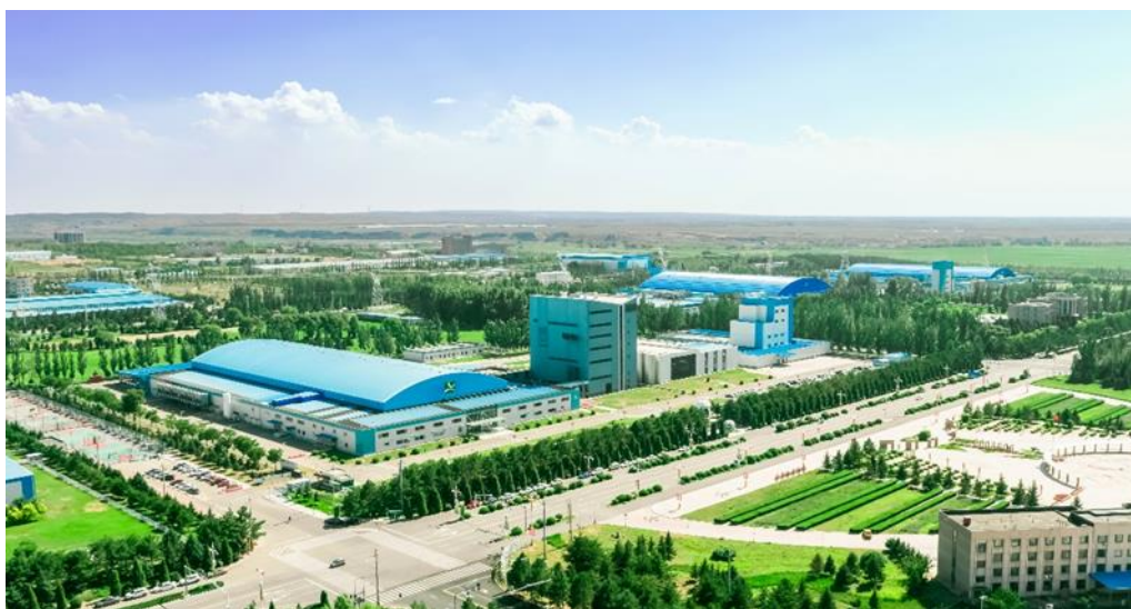
内蒙古欧世蒙牛乳制品有限责任公司厂区

在生产端，蒙牛围绕“能源”这张关键牌，进行绿色生产布局。通过提升产能利用率、提高生产能源利用率、回收富余能源及优化能源结构四个举措，实现全方位生产端的减碳，成效显著。例如蒙牛曲靖工厂，成为乳制品行业首家国际、国内双认证的零碳工厂，通过绿色建材、使用低碳原辅料及清洁能源利用等方式实现低碳可持续发展。2022 年，蒙牛新增 5 家国家级绿色工厂，目前共拥有 27 家绿色工厂。